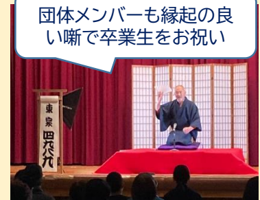
「松竹梅」四九八九さん