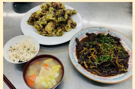
天ぷらには梅やふき味噌を入れて