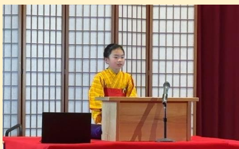
「ケチの鰻」2年生 ひまわりちゃん