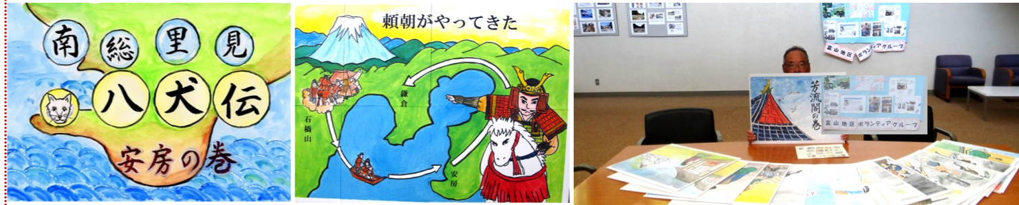
平成29年 「里見八犬伝 安房の巻」

「紙芝居」は、学校やサロンなどで上演することが多いため、原画を拡大して貼り合わせるなどして通常より大きいサイズで作っています。難易度が高い作業が多くありますが、多くの方に楽しんでいただければ苦労のし甲斐があると思って制作に取り組みました。