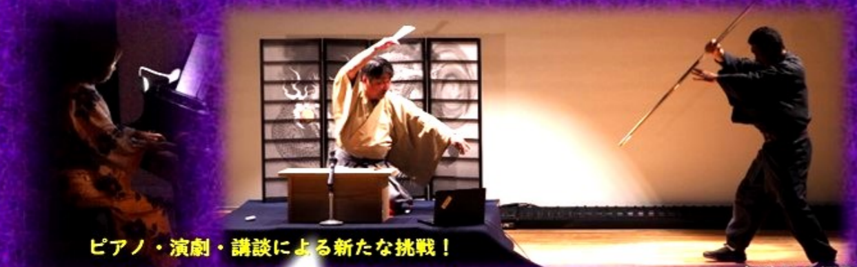
ピアノ・演劇・講談による新たな挑戦！