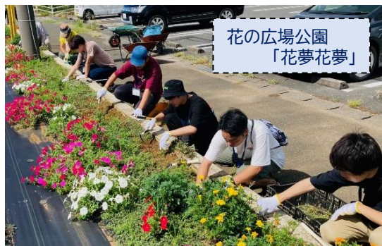
花の広場公園 「花夢花夢」