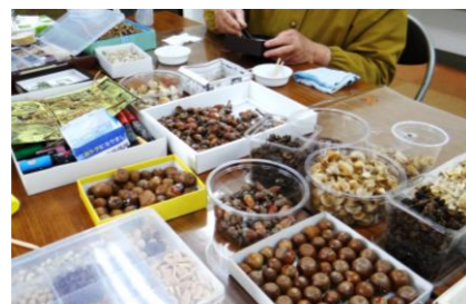
アズキやソラマメに、カボチャやゴーヤの種まで全て材料に。