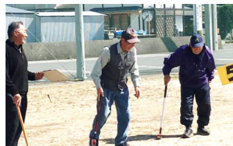
熱戦ながら、笑いも絶えなかったグランドゴルフ。