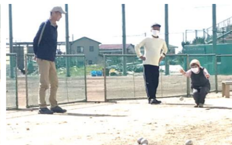
こちらも熱戦となったペタンク。狙いすまして一投！