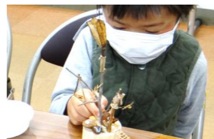
枝のはしご、草木の小舟、ブランコを吊り…、夢中で作る男の子。