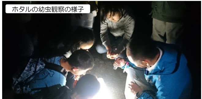
ホタルの幼虫観察の様子

日時: 2019年5月27日(月) 18時30分集合 ※悪天候の場合は室内企画に変更します