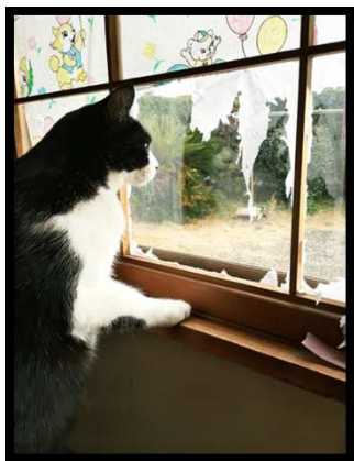
優勝「お外に行きたいな」 5年 関笑華