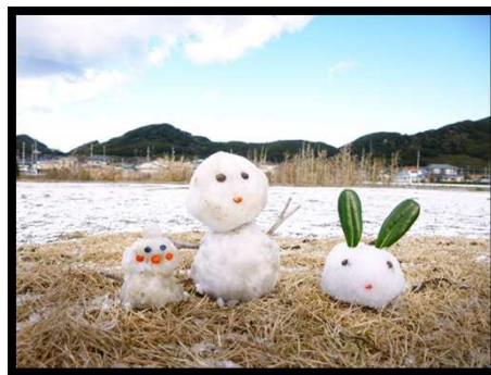
準優勝「初雪三兄弟」 5年 星野美里