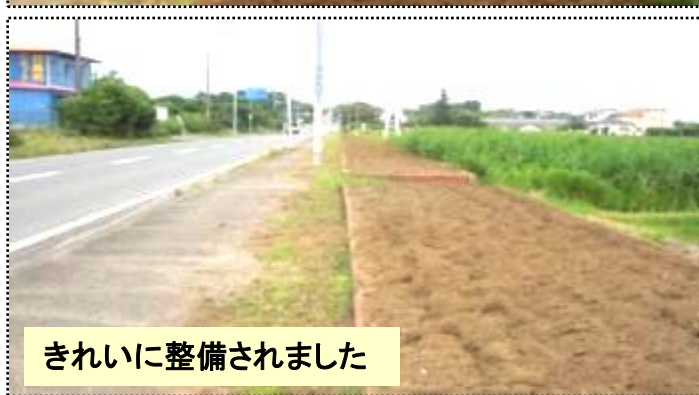
きれいに整備されました

「郷づくりまるやま」は、市のボランティア職員と一緒に6月13日(土)安馬谷の国道沿いにある花だんを整備しました。当日は、大変な作業にもかかわらず皆様のご協力を頂きありがとうございました。この花だんは、市民の方々、嶺南中学校、地元ボランティアグループ「沓見平成同志会」と郷づくりまるやまにより、昨年から季節の花が楽しめます。