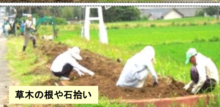
草木の根や石拾い