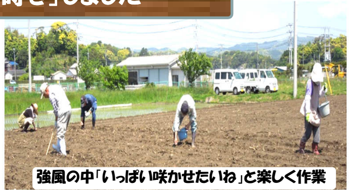
強風の中「いっぱい咲かせたいね」と楽しく作業

今年の「ひまわりフォトコンテスト」用の種は、丸山地域センター窓口においてあります。皆さんどうぞ、お持ちください。