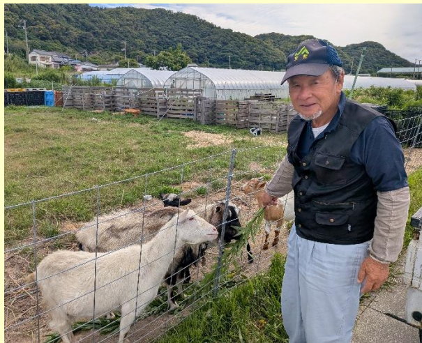
白浜小学校西側農道にて (6月23日8時頃)

ヤギたちが嬉しそうに朝ごはんをムシャムシャ！毎日ごはんを提供する地域の人々と動物の触れ合う姿は、道行く人々にも癒しを与えてくれます。