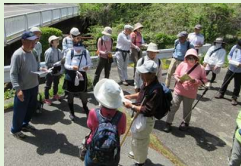
ふらっとフットパス