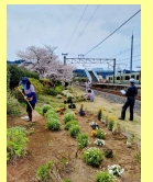
岩井駅構内花壇 美化活動