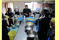
富山未来創造探究ゼミ