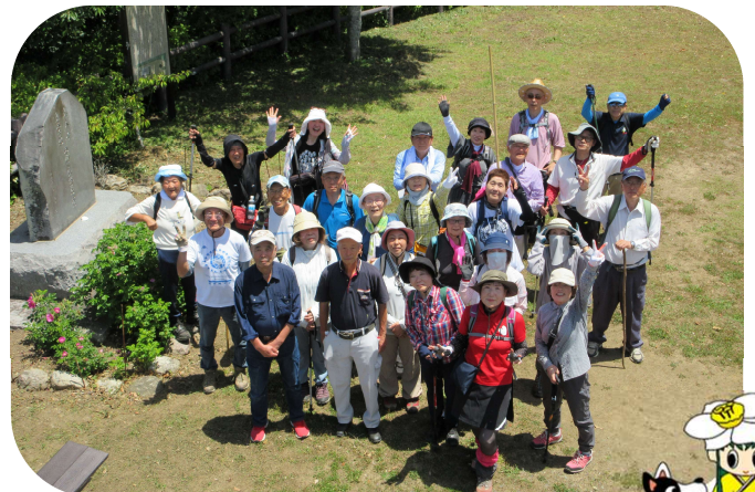
富山山頂にて記念撮影

天皇陛下が皇太子時代妃殿下と登山された富山にスタッフを含め40名で登りました。富山学園で皇太子の登山記録画像を見た後、伏姫籠穴ルートから登り、昼食は地元の旬の食材を使った手作り料理を堪能。また富山の歴史文化に触れ充実した一日でした。