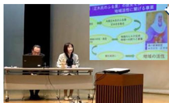
歴史の郷へ応援団三原

学校に行く事が苦手な子の保護者同士が同じ悩みを持つ仲間同士で支え合い、気持ちを安心して話せる場で「気持ちが楽になる」ことが目的です。 参加者アンケートからは、「人に相談し難く悩んでいたが話せる場があり安心した」「仲間の話が参考になった」「孤独感が薄らいだ」などの感想が良く聞かれました。