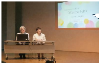
不登校親の会「だいじょうぶ」

今年度は9団体が採択されており、和田地区からは三原郷の歴史探求を通し、地域活性に繋げる事業を行う『歴史の郷へ応援団三原』と、不登校という同じ悩みを持つ保護者同士のピアサポートに取り組む『不登校親の会「だいじょうぶ」』の2団体が参加し、発表を行いました。両団体とも、審査員から活動内容を高く評価され、今後のさらなる活躍に期待の声が寄せられました。