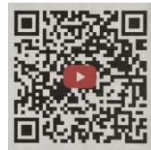
活動紹介動画 (安房国テレビ)