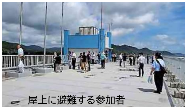
屋上に避難する参加者

9月2日(月)に安房拓心高校にて避難訓練が実施されました。今回の訓練は、千葉県沖を震源とするマグニチュード8.5の地震が発生、大津波警報が発令された事を想定したものでした。訓練には同校の職員・生徒の他、安房医療福祉専門学校内にある学生食堂「花カフェ」のスタッフ、また海発区・松田区ら地域住民も参加し、避難経路や避難場所の確認を行いました。