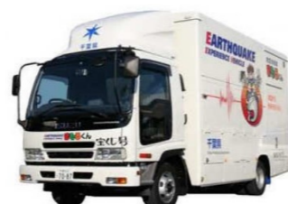
起震車まもるくん

日時：6月16日（日）午前9時から12時（展示と起震車体験は午後1時～3時の間も実施します） 会場：富山岩井コミュニティセンター 募集：20名程度（無料） 講演：自衛隊千葉県千葉地方協力本部木更津地域事務所 体験：起震車（震度7の揺れを体験できます）