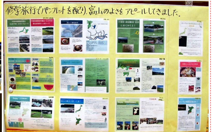
修学旅行でパンフレットを配り、富山のよさをアピールしてきました。 6年生児童が作った富山の魅力をアピールするパンフレットを修学旅行先（鎌倉・箱根方面）で配りました。