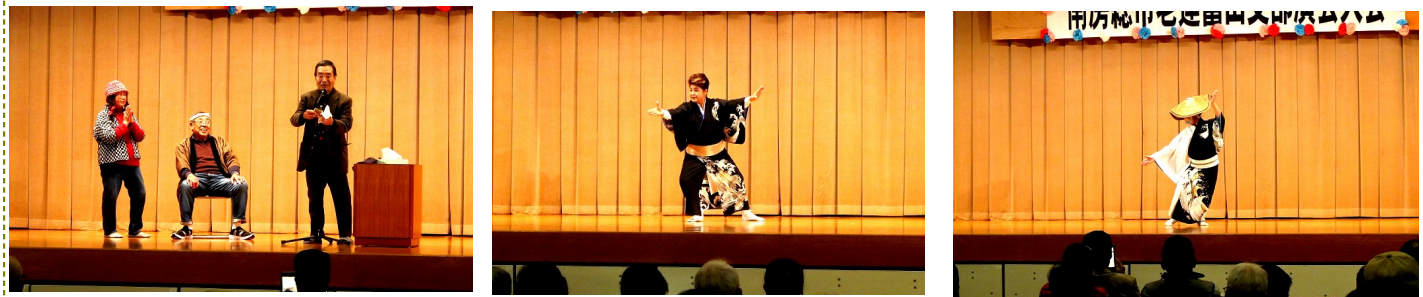
出口松竹会のコントと手品 久枝第一長寿会の踊り 富浦支部の踊り