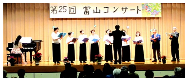
合唱団大地 サイカチの詩