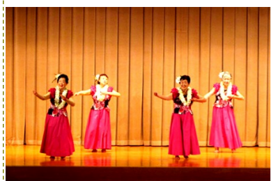
レイホークフラサークル富山 房甫会 道中千里