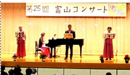
ネコロンダ メンバーは猫大好き