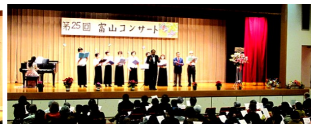
フィナーレはみんなで「野ばら」を合唱