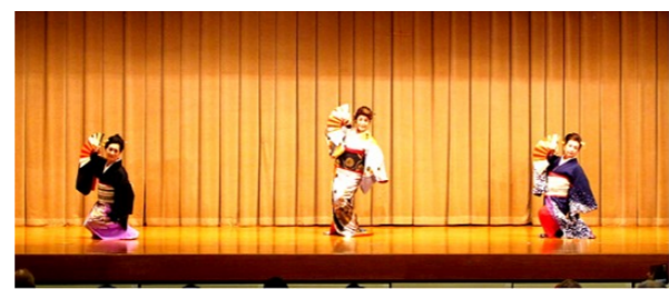
千重会 島田のブンブン