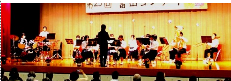
富山中学校 吹奏楽部の演奏

合唱団大地主催の「富山コンサート」が、11月26日に富山岩井コミュニティセンター多目的ホールで開催されました。当日は、個人・団体併せて7サークルが日頃の練習の成果を披露しました。どのサークルの発表も楽器を奏でる技量や響きのある豊かな声で会場が魅了されました。