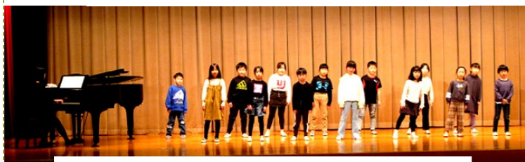
富山小2年生「手をつなごう～共に生きる」