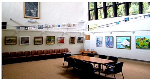
文化協会富山支部会員の作品展示