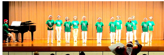
ベッラルーナ クリスマスメドレー