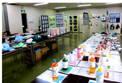
富山学園生徒の作品展示