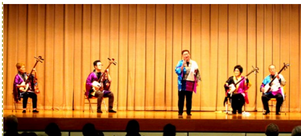
福栄会 白浜音頭ほか