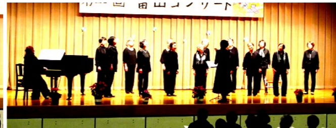
ベッラルーナ アットホームな女声合唱