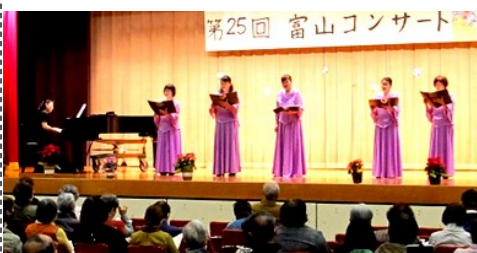
コーラスみよし 2部合唱