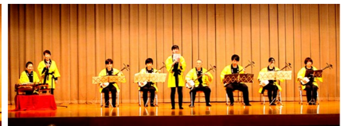
昌宏会 シャンシャン馬道中ほか