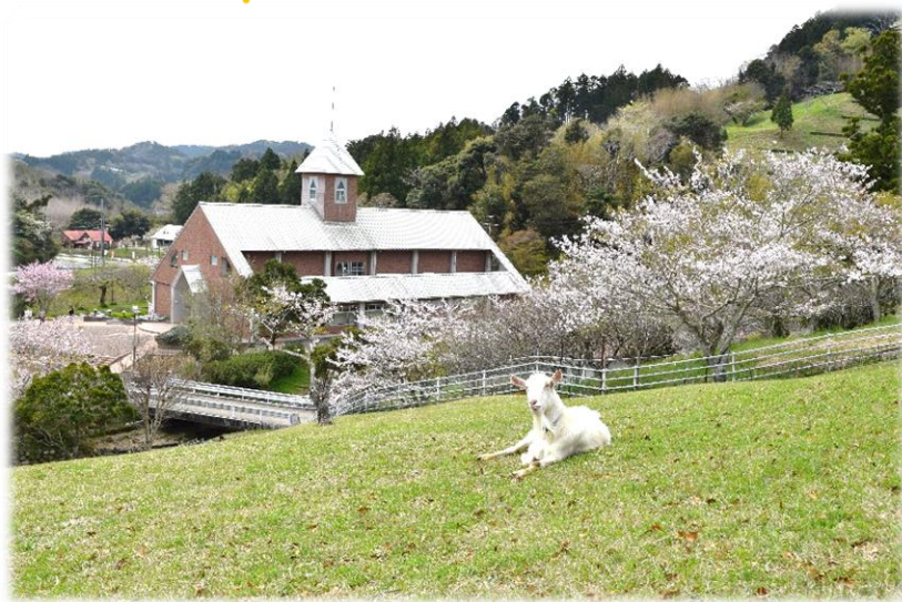
昨年花華賞（最優秀賞）受賞作品『ヤギも花見』