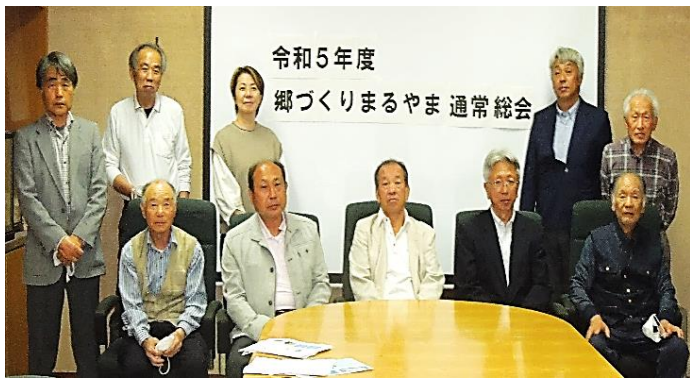
令和5年度 郷づくりまるやま 通常総会

4月20日（木）午後7時00分から、丸山地域センターにて『令和5年度郷づくりまるやま通常総会』を開催しました。新型コロナウイルス感染防止のため、今年度も書面表決を採用し、令和4年度の郷づくりまるやま事業報告・収支決算、今年度の郷づくりまるやま事業計画・収支予算を含め全ての議案が承認されました。