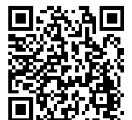
「関東大震災から100年」 特設サイト