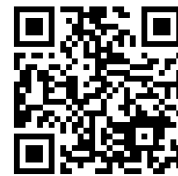
J-SHIS 地震ハザードステーション

関東大震災から100年を経て、今後30年以内に震度5弱以上の地震発生確率が、谷向地区で91.2%(J-SHIS地震ハザードステーションHPより)である今、ご自身・ご家族・ご近所などで、「防災」「減災」について考える時間をつくってみてはいかがでしょうか。