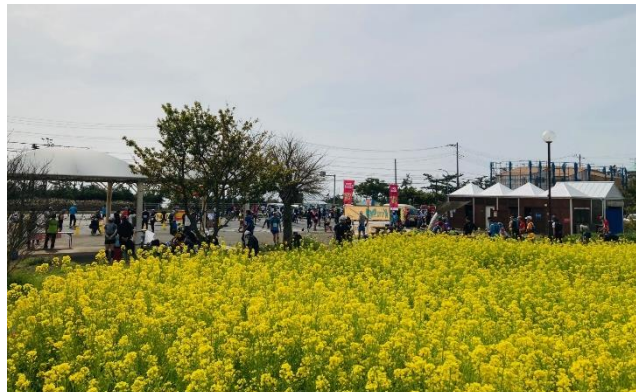
花夢花夢公園は菜の花が満開