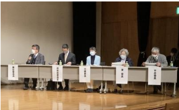
千葉工業大学 鎌田教授他審査員