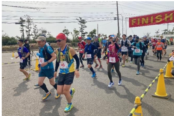
281名の男女がエントリー