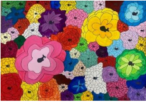
チーム花鯨会長賞 三芳小6年 平井美結菜