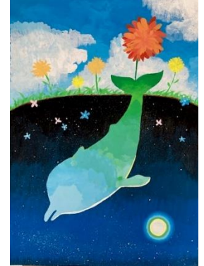
優秀賞 拓心高1年 不川煌