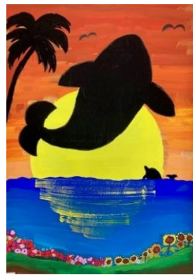
優秀賞 白浜小5年 里見楨莉