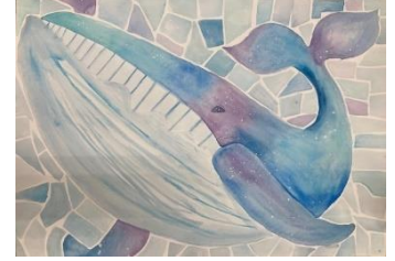
優秀賞 白浜小6年 梶山まるみ