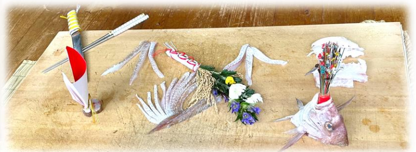
鯛で美しい稲穂を表現「瑞穂の鯛」