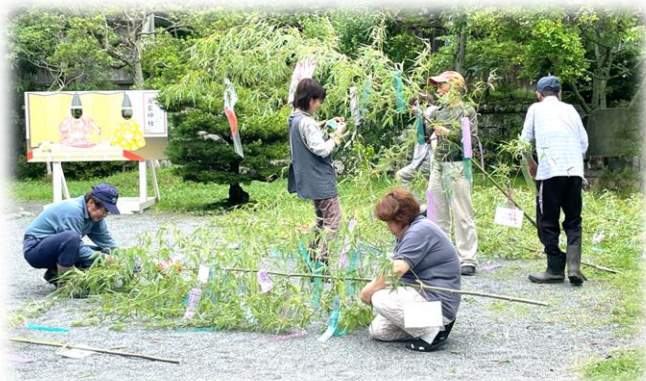
部会員、谷津区、氏子の方々に子供たちの短冊の飾りつけと境内の準備をしました

*涼詣での演出で境内に飾るガラス風鈴が不足しており、ご家庭で不要となり、お譲りいただけるガラス風鈴がございましたら事務局までご連絡頂けるとありがたいです。(☎44-1113)