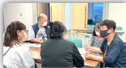
個々の状況に合わせた授業が行われていました

6月10日に外国人向け日本語教室が開催されました。南房総市内の外国人を対象にアットホームな雰囲気の中、ボランティア講師による日本語のきめ細やかな指導が行われていました。