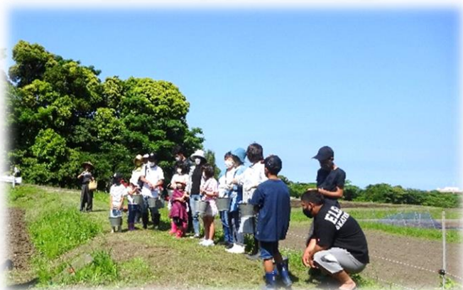
たくさんのお花さかじいさんに来ていただきました！

地域の環境美化と活性化を目指し、今年も川口区高徳院周辺の休耕地にて、コスモスの種まきイベントが4日間にわたり行われました。祭りの屋台の木遣り節に合わせて多くの「花さかじいさん」が「まけよと～！さけよと～！」と楽しく種まきを行いました。コスモスは予定通りに成長すれば8月頃には開花し満開となり、10月末頃まで約3000坪のピンクの絨毯が楽しめます。