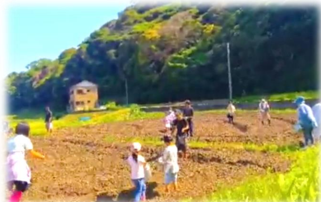
↑ 種まきイベントの様子