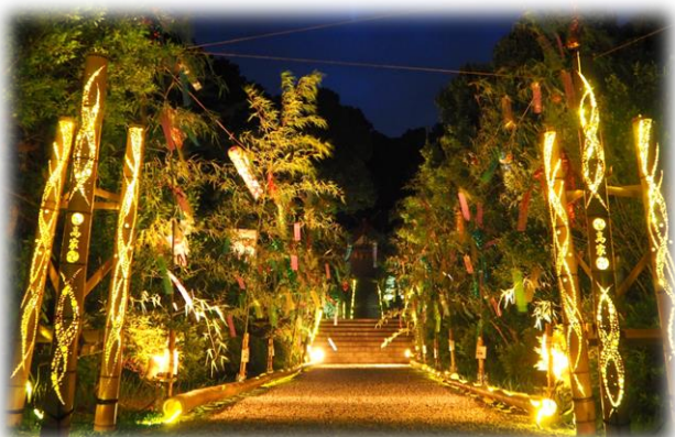
夏の夜空のもと多くの短冊が風にゆらいでいました。