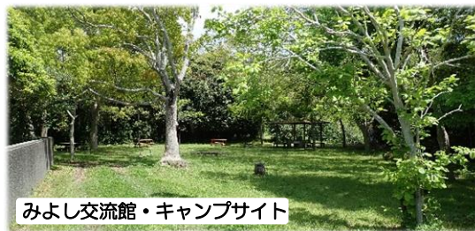
みよし交流館・キャンプサイト

刈払機や芝刈機を使い会員13名で2時間ほど作業をしました。草刈り以外に、建物に寄りかかっていた木々の剪定や敷地内の設備の掃除もしました。明るく管理しやすい環境になりました。