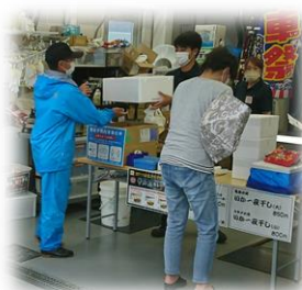
お取り寄せマルシェ

コロナ禍でイベント開催がままならない中、「ちくら漁港朝市」の灯を絶やさないため、事前電話予約とテイクアウトで運営する“お取り寄せマルシェ”の開催など、知恵と工夫でご利用者のニーズに応えながら千倉港のにぎわいづくりを目指していきます。