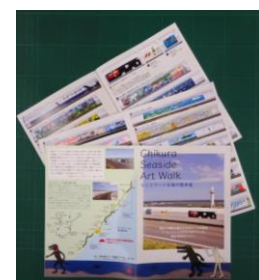
「アートな海の散歩道」ガイドマップ

豊かな山や海の自然、歴史や文化を生かしたまちづくりに向けて、昨年来行われている「千倉海の壁画再生美プロジェクト」の広報活動の一環として「ちくらアートな海の散歩道」ガイドマップの制作や、海岸・周辺エリアの美化活動をおこなっていきます。