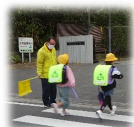
千倉小前のあいさつ運動

明るい笑顔の交わせるまちづくりに向けて、毎月2回千倉小学校前でのあいさつ運動の継続や、移住者支援の一環として耕作放棄地の花畑づくりや生活便利帖アプリの開発などをおこなっていきます。