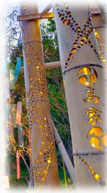
参道の両脇にはクラスごとに笹飾り 校外学習の千倉小生も興味津々 次の『涼詣』の主役は風鈴と竹灯り