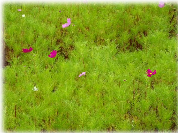
何もなかった休耕地を皆で整備し種を蒔いたところ・・・色鮮やかなコスモスが咲き始めました