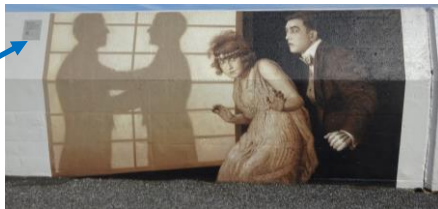
作品・作家を紹介するプレート