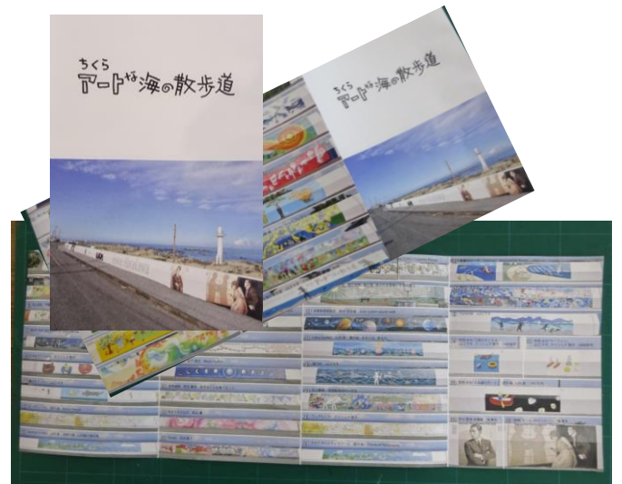
散策のお供になるガイドマップ(制作中)