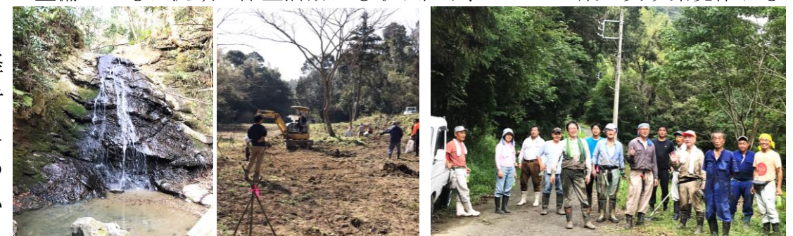
交流の中心「大滝」と「かわたん広場」。「川上かわたん」のメンバー。

子どもたちが気軽に遊べる自然、移住者も地元住民とともに親しめる自然環境の創造に取り組んでいます。