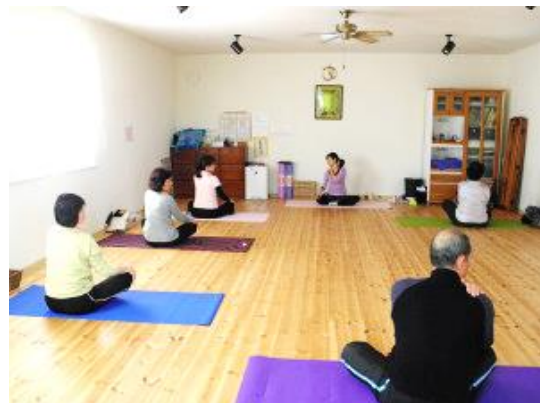
寺島氏のヨガ教室の様子。明るいスタ ジオ。男性の参加も多い。