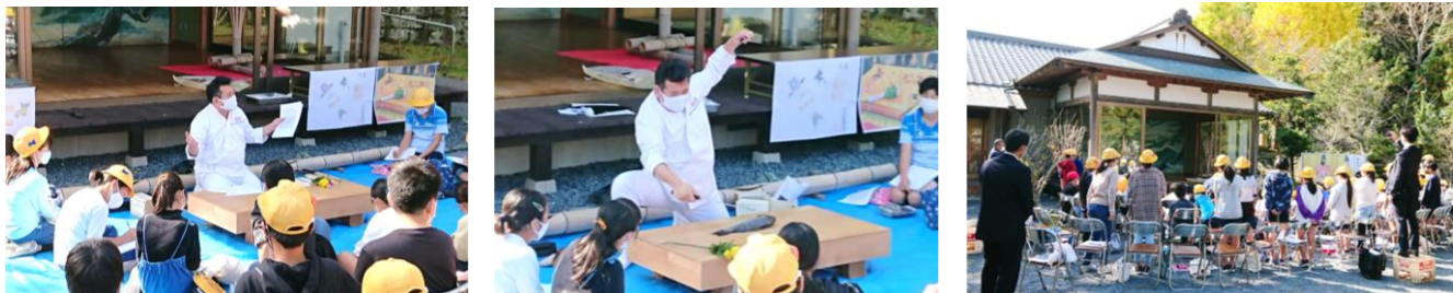
子どもたちはメモを取りながら真剣に見入っていました。【千倉小学校】

庖丁式の式題は鯉だけでも36種あること。陰陽に則った無駄の無い所作の中に、美しさ・繊細さを求める日本人の心があり、料理にその心が反映されることなどの説明を受けました。このチームは今後、高家神社を生かした観光客誘致の為のプロジェクトに取り組んでくださるそうです。