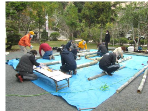
皆で竹灯籠を作りました