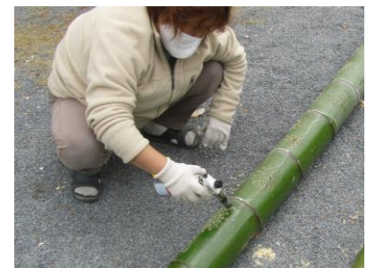
仕上げに竹を炙り艶出し