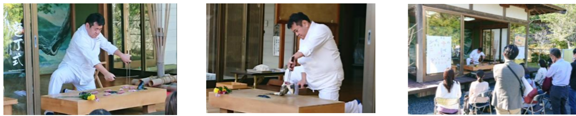
包丁の表(陽)・裏(陰)での陰陽の流れある動きに解説を添えて【千葉大学】