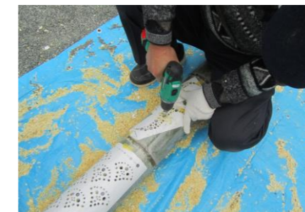
図案に添って穴を開けます