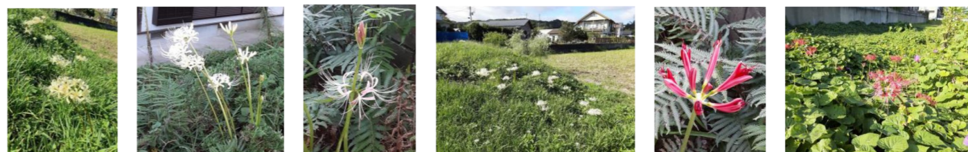
《季節の花 彼岸花 (曼珠沙華) Equinox Flower》

新デザインは現在検討中ですが、従来の文字だけではなく、写真などをプリントして見映えアップを目指しています。