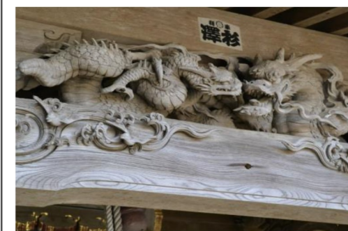
白間津 日枝神社 中備「子引き龍」

ガイドマップを片手にお出掛けください。 ●モデルコースやグルメガイドも載っています。