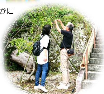
観光客も短冊に願いを込めて…