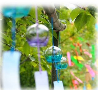
風鈴の音も涼やかに