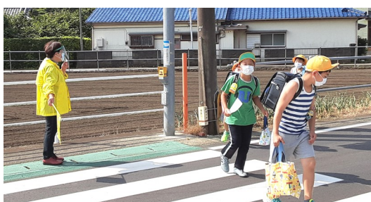
見守られて元気に登校する児童

新型コロナウイルス感染予防の為、きずなの会員がマスクとフェイスシールドを付けた見守りとなりました。子どもたちの元気な「おはようございます」という声に、臨時休校となっていた小学校、3ヶ月半ぶりに活気が戻ってきました。元気に過ごしてほしいですね！