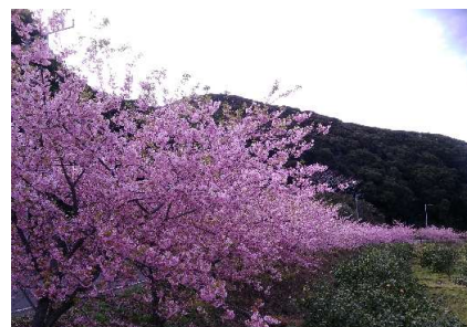
2月、同場所の満開の河津桜