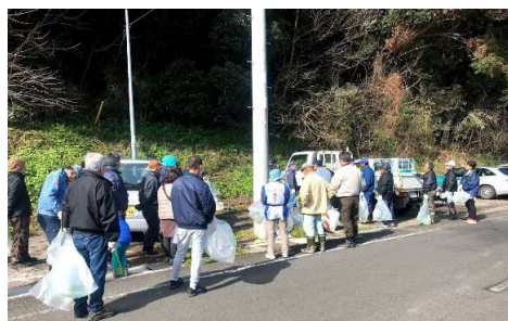
開始前に分別方法について確認

「きらり」ごみ拾いの特徴は、毎月第3日曜日の9時に全員であいさつをしてからごみ拾いを開始し、10時には仕分けを完了します。東西南北、広範囲にわたり、たっぴりとごみを拾う事ができます。今回少し足を伸ばしたところ、耕作放棄地に大量のごみが捨てられていました。以前にきれいにごみを取り除いた場所でしたが、また元通りのゴミ捨て場状態になっていました。いつになったら、ポイ捨てや不法投棄がなくなるのでしょうか。これからも地道に活動を続けていくしかないですね。令和2年も引き続きご協力宜しくお願いします。