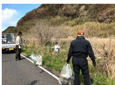
耕作放棄地に大量のごみ