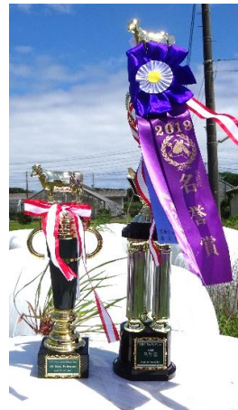
・受賞トロフィー