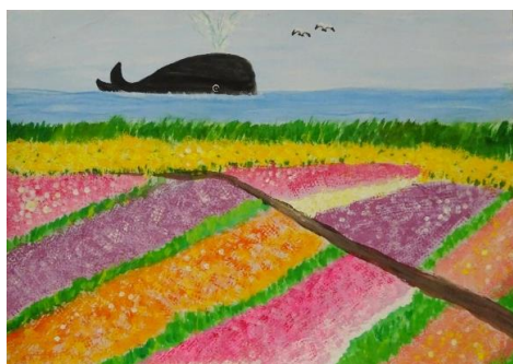
・昨年の入賞作品より

『花』と『くじら』の絵画コンクール実行委員会では、下記の通り南房総市内の児童・生徒を対象とした、『花』と『クジラ』をテーマとする絵画コンクールを開催いたします。奮ってご応募ください。