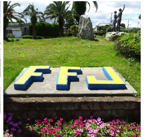
・♪～われらの誇り・・・♪

安房拓心高校・畜産部が飼育管理する乳牛が、2つの審査会で好成績を収めました。受賞牛は『タクシンRFブラッドニックフェリシアET』。静岡県で行われた全国大会『2019セントラルジャパンホルスタインショウ』の第5部(未経産、21か月以上24か月未満)で第2位。県内外の優秀牛を一堂に集めて、茂原市で行われた『長夷ブラックアンドホワイトショウ』では第5部でチャンピオンになり、未経産の1位だけを集めたチャンピオン戦でも1位に選ばれジュニアチャンピオンに輝きました。拓心高校・畜産部では、部員4人が審査会に向けて労を惜しまずに乳牛を育てています。今回の成果を励みに今後の審査会でも好成績を目指しています。