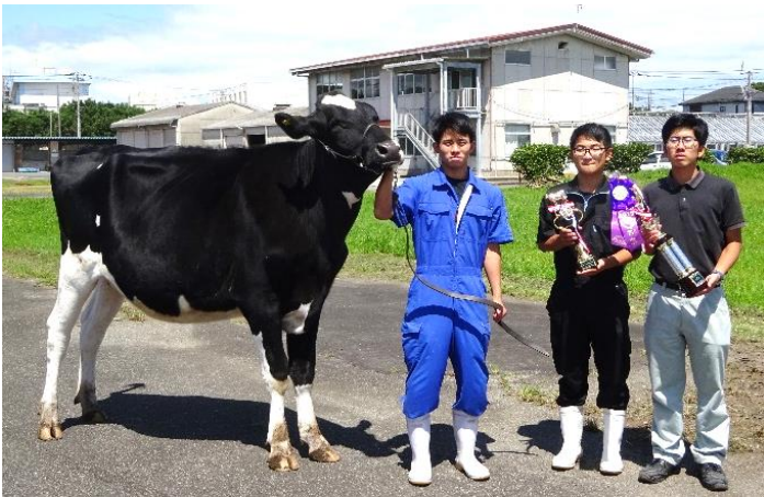
・受賞牛と畜産部のみなさん