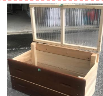
引き出しを再利用した「キューロ」。

ご自宅の屋外で管理可能な方のみ対象とさせていただきます。ご了承ください。 主催・問合せ 富山地域づくり協議会「ふらっと」 ☎57-3000 (土日祝日を除く) 協力 社会福祉法人太陽会障害福祉サービス事業所「らんまん」、社会福祉法人安房広域福祉会 指定障害者支援施設中里ワークホーム、南房総市社会福祉課、安房ふんころがし