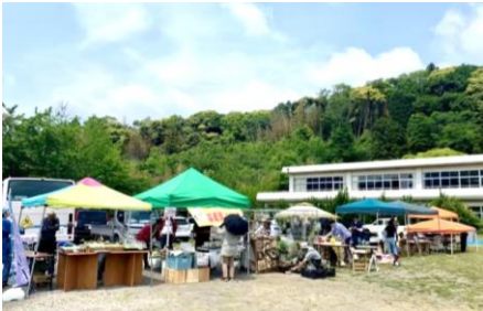
出店数最多で、平群の校庭は大いににぎわった。

5月12日(日) 11時から、旧平群小校庭で、「へぐりマルシェ運営委員会(NPO法人:南房総リパブリック)」主催による「へぐりマルシェ」が開催されました。今回は、地元はもとより、地域外からも多くの出店があり、食品類やオリジナルクラフトなどの販売の他、体験型のブースなどもあったりと、バリエーションに富んだ「ちいさな商店街」を思わせるマルシェでした。来場者は、平群に突然出現した「ちいさな商店街」を十分満喫していました。