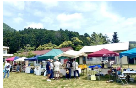
居並ぶ露店に来場者の集まる様子は、さながら商店街。