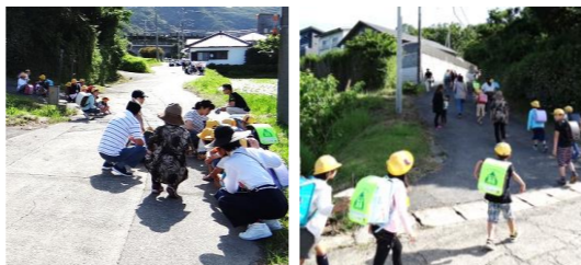
まずはしゃがんで安全確保

5月30日(木)、市内小中学校を対象に「登校時一斉避難訓練」が行われ、保護者や教員、地元有志とともに「ふらっと」も、児童・生徒たちの見守りをしました。登校時の大地震および津波発生を想定し、登校班ごとに考えたルートで観音山へ避難する訓練で、この日も、交通安全など見守りしながら、子どもたちの自主的な避難行動をサポートしました。