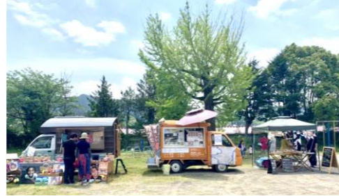
今回も、テント出店の他に、多彩なキッチンカーが集まった。