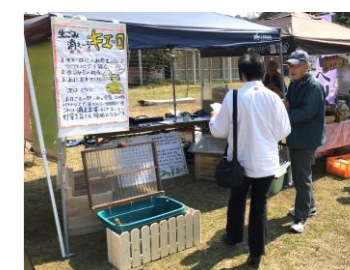
3月の「へぐりマルシェ」でも紹介。多くの人々が足を止めた。