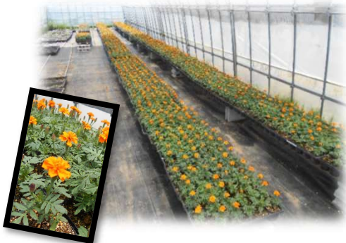
マリーゴールドは花が咲きました。いよいよ次回は植付けです。

5月9日と16日(ともに木曜)2週にわたって、プランターのキンセンカを抜取り、土の水消毒を行い植付けの準備を行いました。