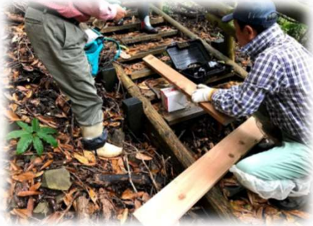
まずは傷んだ部材の撤去

作業は全て現場で行うため、材料を手分けして運び、寸法に切り、防腐剤を塗り、傷んだ部分の板を取り外して新しいものと交換しました。来月には100人を超える小学生が城山を歩きに訪れる予定ですので、次回展望台の草刈りを臨時で行うことにしました。