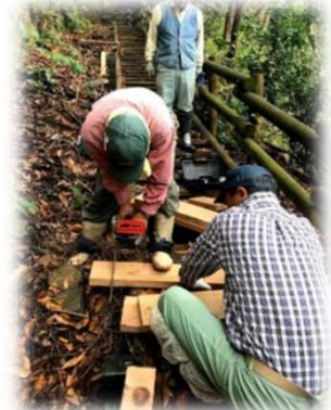
現場で板材の寸法合わせ