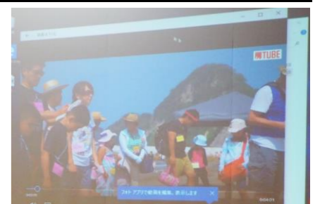
昨夏、子どもを対象に岩井海岸で開催した「海賊王」イベントを動画で報告。このイベントでは、子どもたちは海遊びだけでなく海岸清掃も行った。