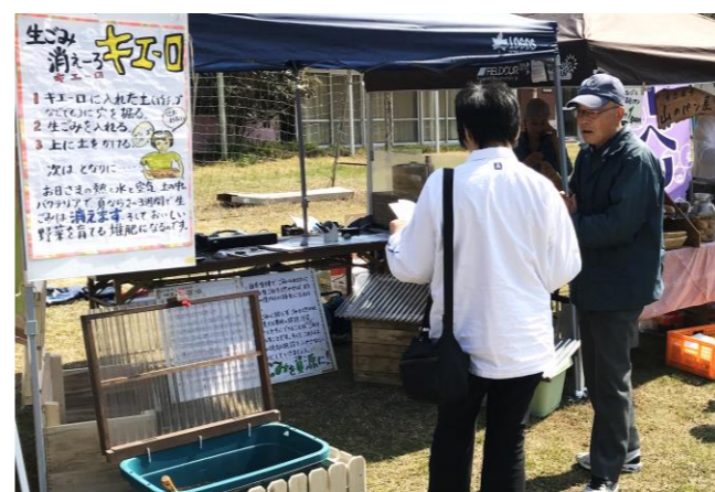
キエロに多くの来場者が興味を持った

「ふらっと」は、安房ふんころがしの会・NPO 法人南房総エコネット・白浜地域づくり協議会「きらり」と合同で出店し、木製コンポスト「バクテリア de キエロ」を紹介しました。これまで先進地視察や他団体との連携など行ってきましたが、前述の3団体と情報交換や今後の活動を話し合う「キエロサミット」を今年開催し、今回の出店となりました。