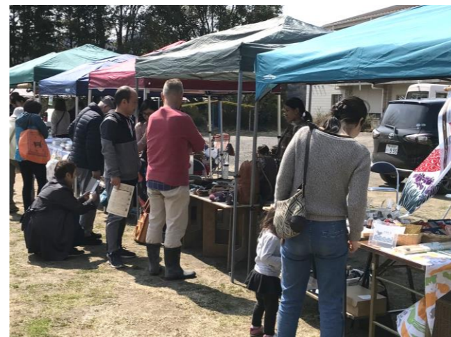
今回のマルシェも幅広い年代の来場者でにぎわった

マルシェは15団体が出店。焼きそばやバーガー、様々な手作りパン、観葉植物や珍しい雑貨の数々、手作り体験など多彩なブースが立ち並び、来場した人々を楽しませました。