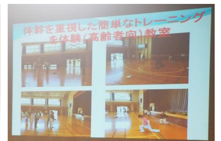
子どもだけでなく、中学生を対象にしたプログラムや、「高齢者向けの体力測定会」で特別講座なども行った。