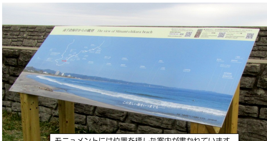
モニュメントには位置を標した案内が書かれています