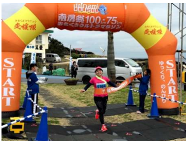
女子のトップが元気良くゴール