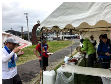
疲れた体に染みる…かな