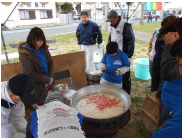
千人鍋で調理スタート

3月23日(土)、第3回南房総みちくさウルトラマラソン(勝浦スタート野島崎ゴール)が開催されました。100キロと75キロのコースは、勝浦をスタートし外房黒潮ライン、房総フラワーラインの海岸線を巡り、野島崎灯台がゴールとなります。前日まで半袖で過ごせる程の暖かい陽気でしたが、23日は急に気温が下がり、10時頃には雨が降ったりと、一日中寒い日となりました。寒い中走ってくる走者に、塩浦海水浴場駐車場では、白浜ウインクス関係者がいちごトッピングアイスクリーム、ゴールの野島崎では「きらり」と「白浜マリニーズ」の関係者がいそび汁を振るまい応援しました。