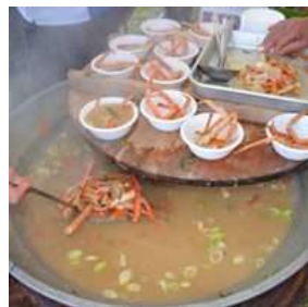
具たくさんな磯汁