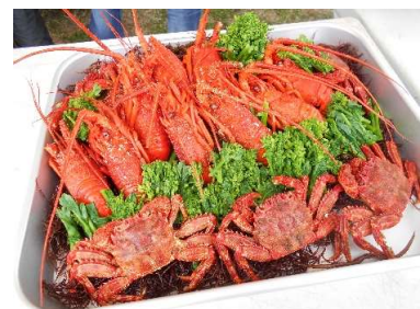
伊勢エビ・ずわい・いそび・菜花 インスタ映えセット