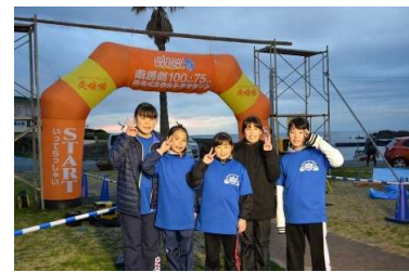
ゴール地点を手伝ったこども達