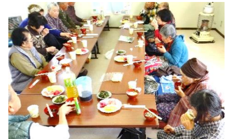
「いのばた」は毎月20日井野集会所で開かれています