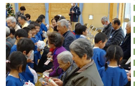
最後はお菓子のプレゼント交換