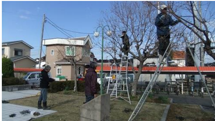
メンバー総出で、イルミネーションの設置作業に汗を流しました。

今年も、南房総市観光協会岩井支部で岩井駅前伏姫公園に、岩井の海と山をイメージしたイルミネーションが光を放っています。昨年12月13日に、観光協会関係者一同が伏姫公園でイルミネーションの設置作業を行い、12月15日から点灯を始めました。公園を彩る淡い光に心が癒されます。2月15日まで点灯していますので、足を運んでみてはいかがでしょうか。