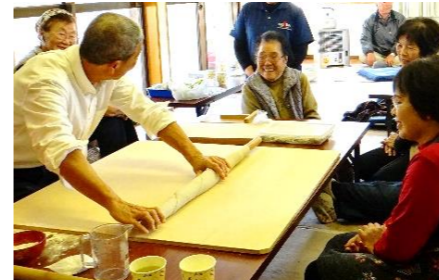
そば打ち台を囲んで楽しくおしゃべりする参加者

でき上がったそばは、太さの不揃いもご愛敬、いくつものざるに盛られてふるまわれました。参加者がそれぞれ持ち寄った色とりどりの漬物やお菓子などつまみ、格別の手打ちそばを味わいながら、おしゃべりに花を咲かせました。