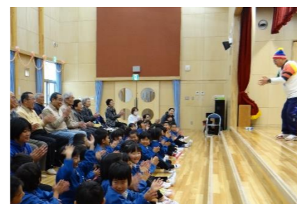
シニアクラブの愉快的レクに 大人も子ども大喜び