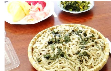
ざるに盛られた手打ちそば