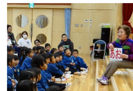
脳トレクイズには みんなで夢中