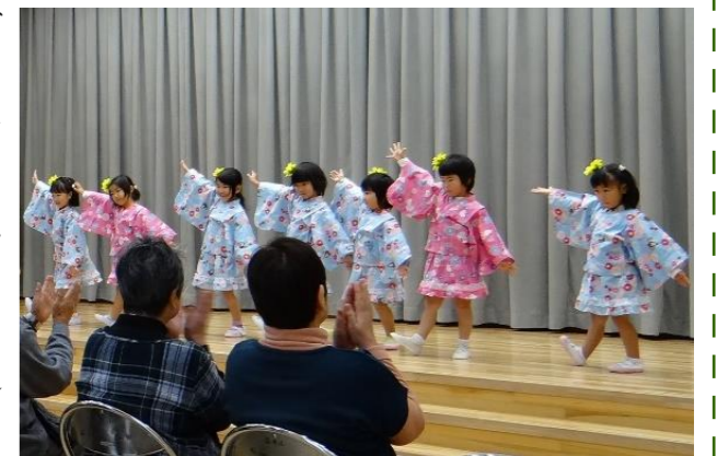
笑顔はじける女の子たちのダンス