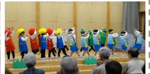
年少さんの「ももたろう」 鬼も元気いっぱい