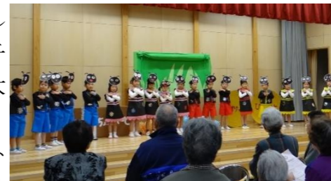
年長さんの「ありんこのアリー」 カワイイありたちが歌って踊る