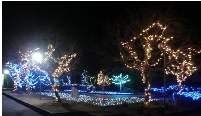
岩井の海と山をイメージしたイルミネーションの中心には、伏姫と八房を覆うハートの光が浮き立ちます。