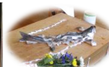
天空に昇る龍の姿