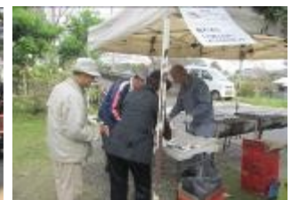
焼サンマも好評でした