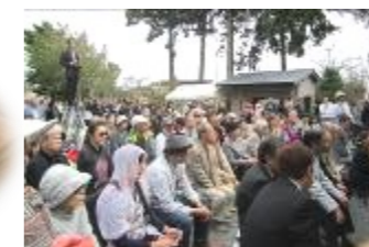
多くの方に拝観いただきました