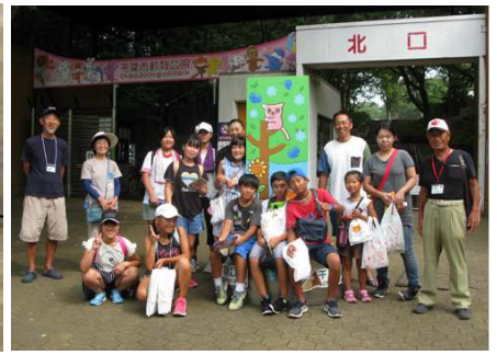
音叉を使って音の伝わり方を実験 残響室では大声で音量の競争 千葉市動物公園で全員の記念撮影