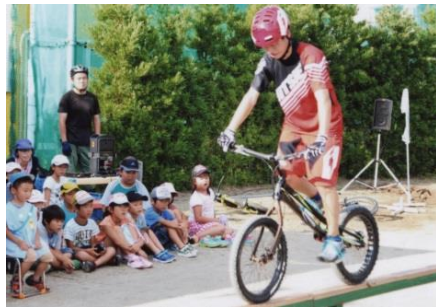
平均台の上でバランス!