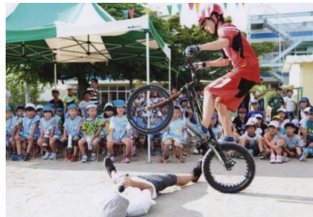
人間の上をジャンプ!