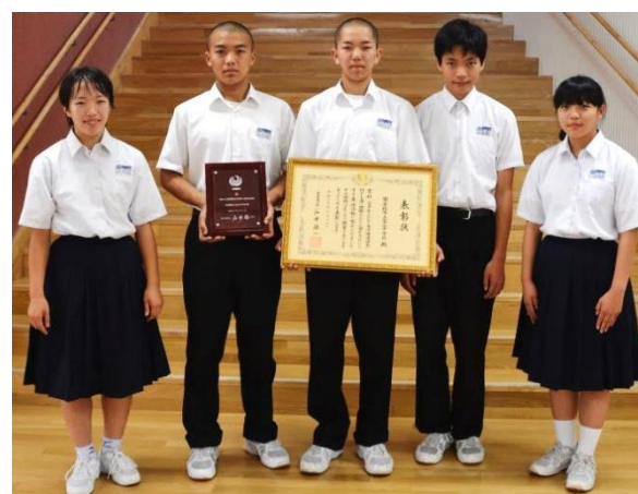
記念の盾と表彰状を手にする生徒会役員

この度富山中学校が、海事に貢献する功労者・団体を表彰する「平成30年「海の日」海事関係功労者表彰」において、最高位の「国土交通大臣表彰」を受賞しました。