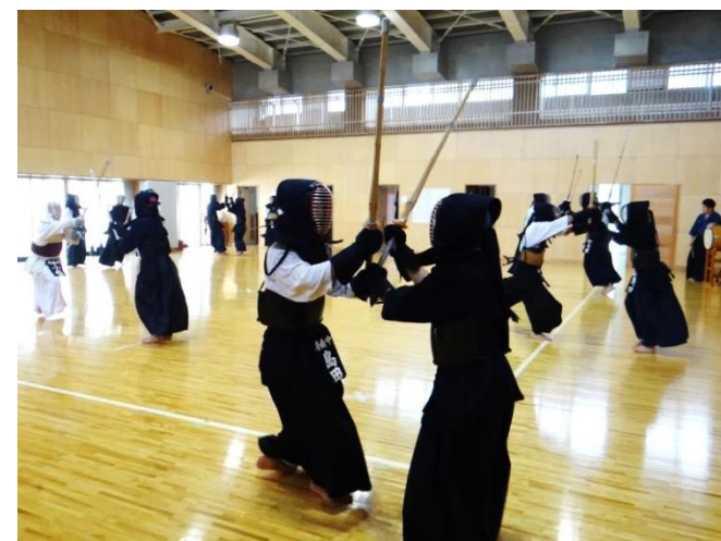
合同練習の様子。上位進出を目指して気合十分!

取材したこの日、富山学園では、房南中との合同練習が行われていました。剣道部顧問の指導が飛ぶ中、全員が鋭い動きとともに、気合の入った声を上げながら、気迫こもる練習に精いっぱい取り組んでいました。