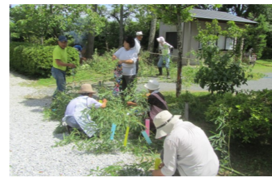
笹を切り出し、短冊を取り付けた笹が立てられています