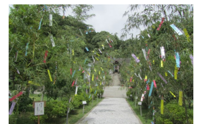
五色の短冊が風に揺れ美しい