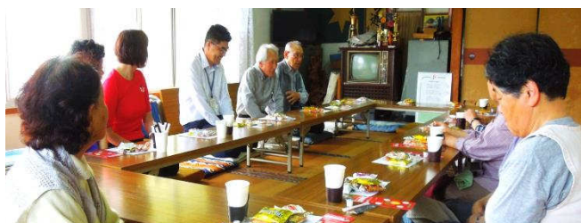
お話している様子

その後、畳の部屋へ移動してお話しました。なかなかお会いできないのでしょうか、お久しぶりという声が聞こえ無事に終わりました。