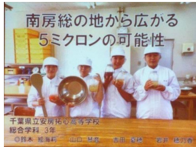
*工夫あふれる発表画像