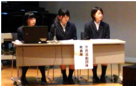
*一生懸命プレゼンする拓心高生