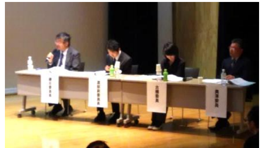
*厳しくも温かい指摘をする審査員

4月21日にとみうら元気倶楽部さざなみホールで、南房総市主催「市民提案型まちづくりチャレンジ事業」の公開プレゼンテーションが行われ、安房拓心高校農業クラブ 花酵母プロジェクトチームが、『南房総の地から広がる5ミクロンの可能性～花酵母プロジェクト～』を発表し、見事にチャレンジ事業に採択されました。