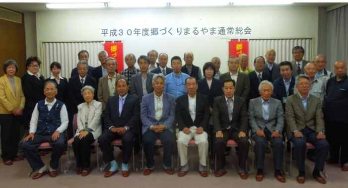
平成30年度郷づくりまるやま通常総会

4月28日(土)午後7時から、丸山公民館 中会議室にて、第8回郷づくりまるやま通常総 会が開催されました。