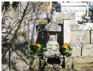
光厳寺 里見義頼の墓 墓の両脇に桜があります

岡本城址、光厳寺、興禅寺など16世紀中頃から後半の里見氏7代、8代の歴史をたどるコースです。