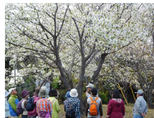
大房岬の桜 昨年のウォーキングの様子