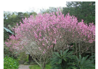
富浦体育館裏の真勝寺の桃の花