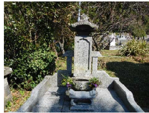
興禅寺青岳尼供養塔