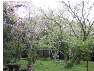
岡本城址ではオオシマザクラ、ソメイヨシノ、すみれの群生などが見られます