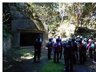
大房岬の戦争遺跡