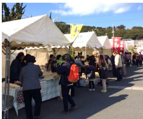
昨年の「なの花まつり」の様子

旧和田町における早春の一大イベント「なの花まつり」は、装いも新たに『和田町 なの花まつり 2018』として下記の要領で開催します。今回は南房総フラワーマーチの2日目と重なり、お祭り会場近辺が折り返し点でもあることから、フラワーマーチ参加者へのおもてなしサポートも兼ねて、和田町内外に「わいわいと温かみのある おらがまち」を積極的に発信いたします。皆様のご来場をお待ちしています。