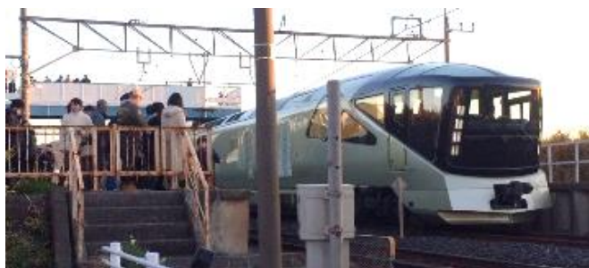
和田浦駅で初日に輝く「TRAIN SUITE 四季島」

JR東日本の豪華寝台列車「TRAIN SUITE 四季島」が元旦朝、初めて千葉県内を運行し午前6時40分頃和田浦駅に到着し乗客が跨線橋から初日の出を拝みました。