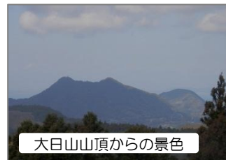
大日山山頂からの景色

● 増間の大日山を歩き、 ● 下山後は、毎年3月1日 ● に行われている稲作の豊 ● 凶などを占う神事で県指 ● 定無形文化財の「増間の ● 御神的神事(おまとしん ● じ)」を見学します。