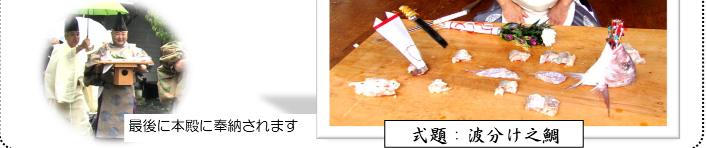
最後に本殿に奉納されます 式題：波分け之鯛