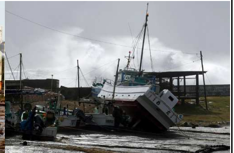
陸揚げした船も大きな被害