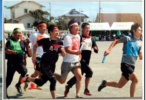
白熱した地区対抗リレー