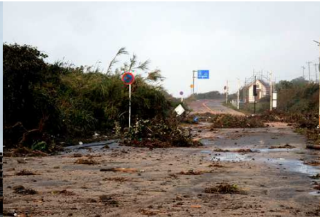
根本の海岸道路は土砂で埋まる