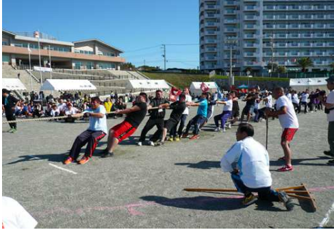
応援も一番力が入る綱引き

今年の町民体育祭は晴天に恵まれた10月8日(日)、白浜中学校グラウンドで盛大に行われました。一昨年昨年と雨で中止となり、3年ぶりの開催となったこの日は秋晴れの運動会日和となりました。14地区から約2,000人が参加、フィナーレの地区対抗リレーでは応援席から大きな声援が送られましたが、下沢地区が勝って総合優勝も獲得しました。