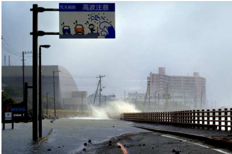
フローラルホール前は冠水

10月23日(月)未明の台風21号による暴風雨は、船や小屋そして港湾施設など漁業関係と農作物への塩害など甚大な被害をもたらしました。海岸線では満潮と重なり、海水が道路を越えたところもありました。復旧にはかなりの時間が掛かりそうです。