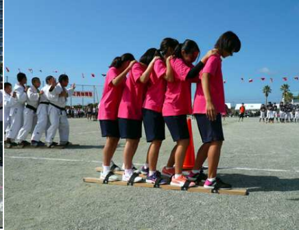
中学生の部活対抗ムカデ競走